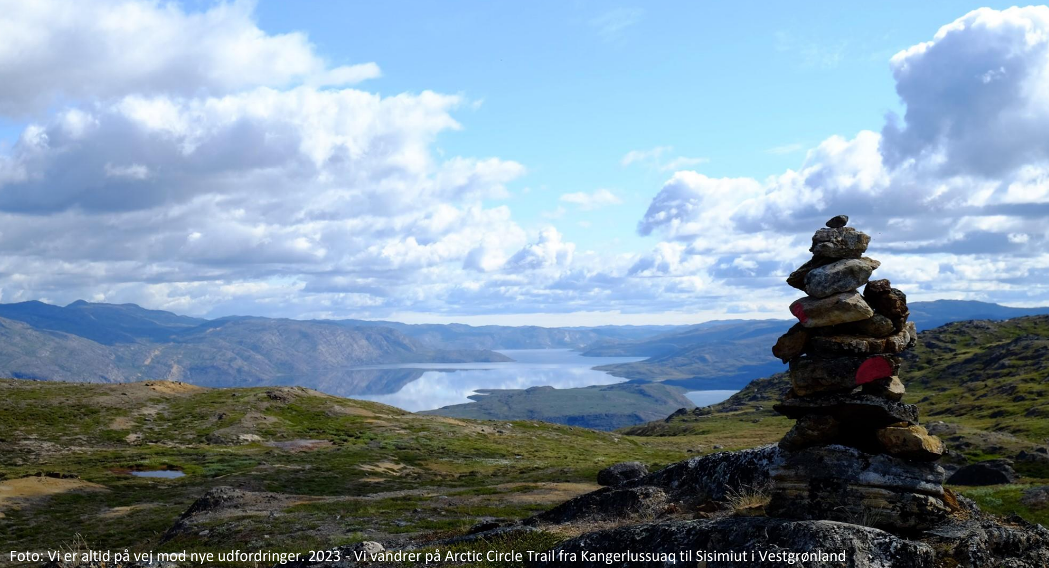
Foto: Vi er altid på vej mod nye udfordringer. 2023 - Vi vandrer på Arctic Circle Trail fra Kangerlussuaq til Sisimiut i Vestgrønland