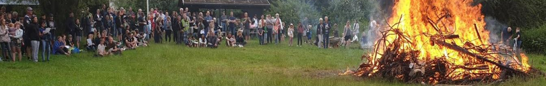
Foto: Med 1000 deltagere er Stjernegruppens Sankt Hans arrangement på Hindemosen Odenses største for børnefamilier - 2018