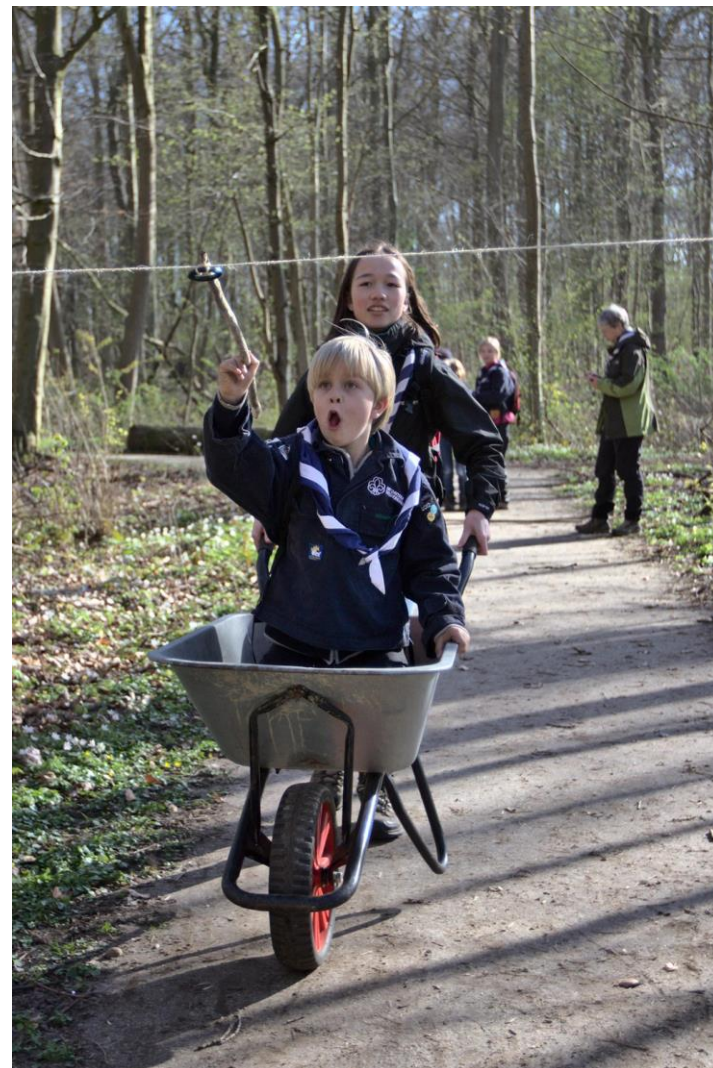
Foto: Minispejdere på løb i skoven ved Hindemosen