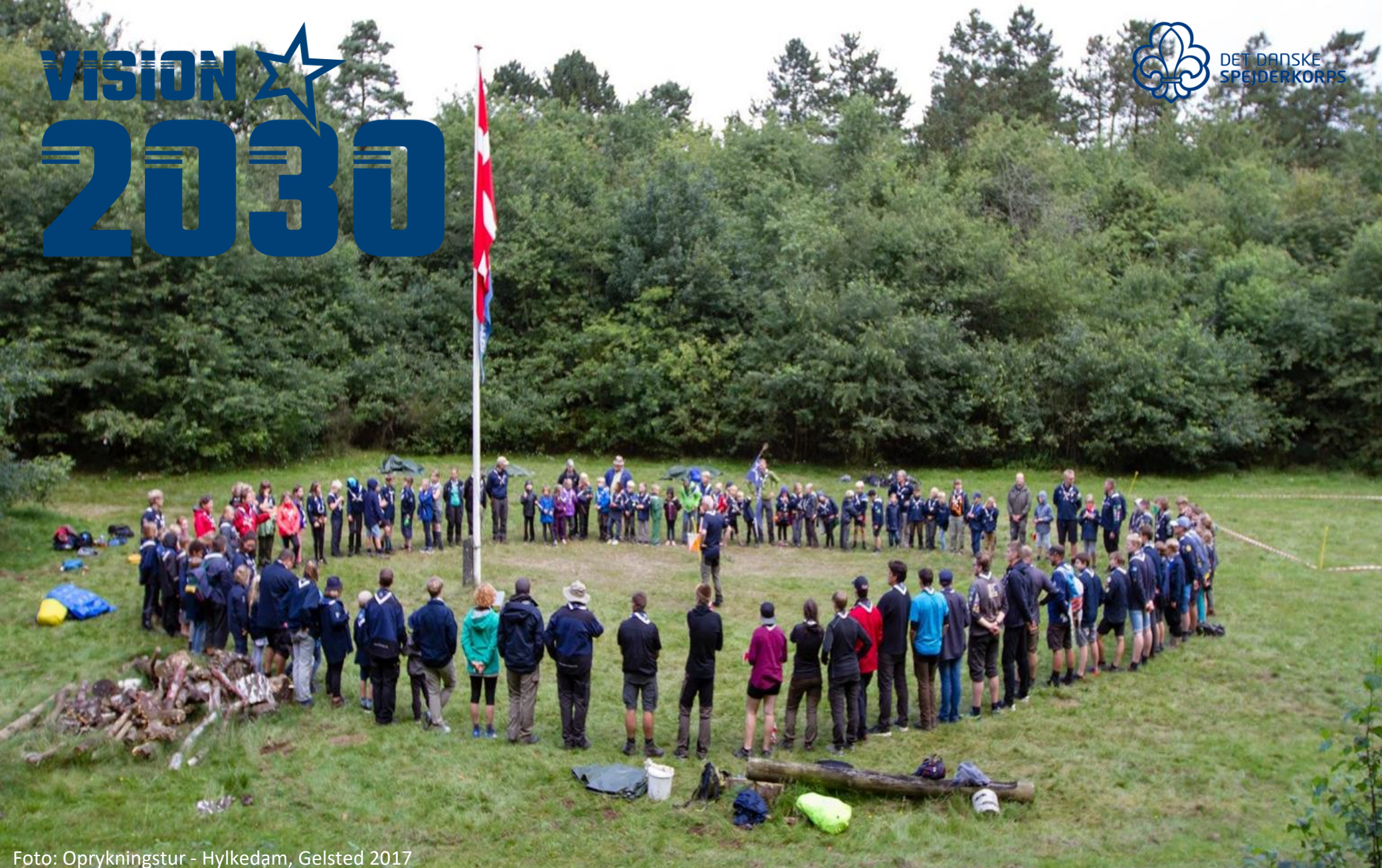
Foto: Oprykningstur - Hylkedam, Gelsted 2017