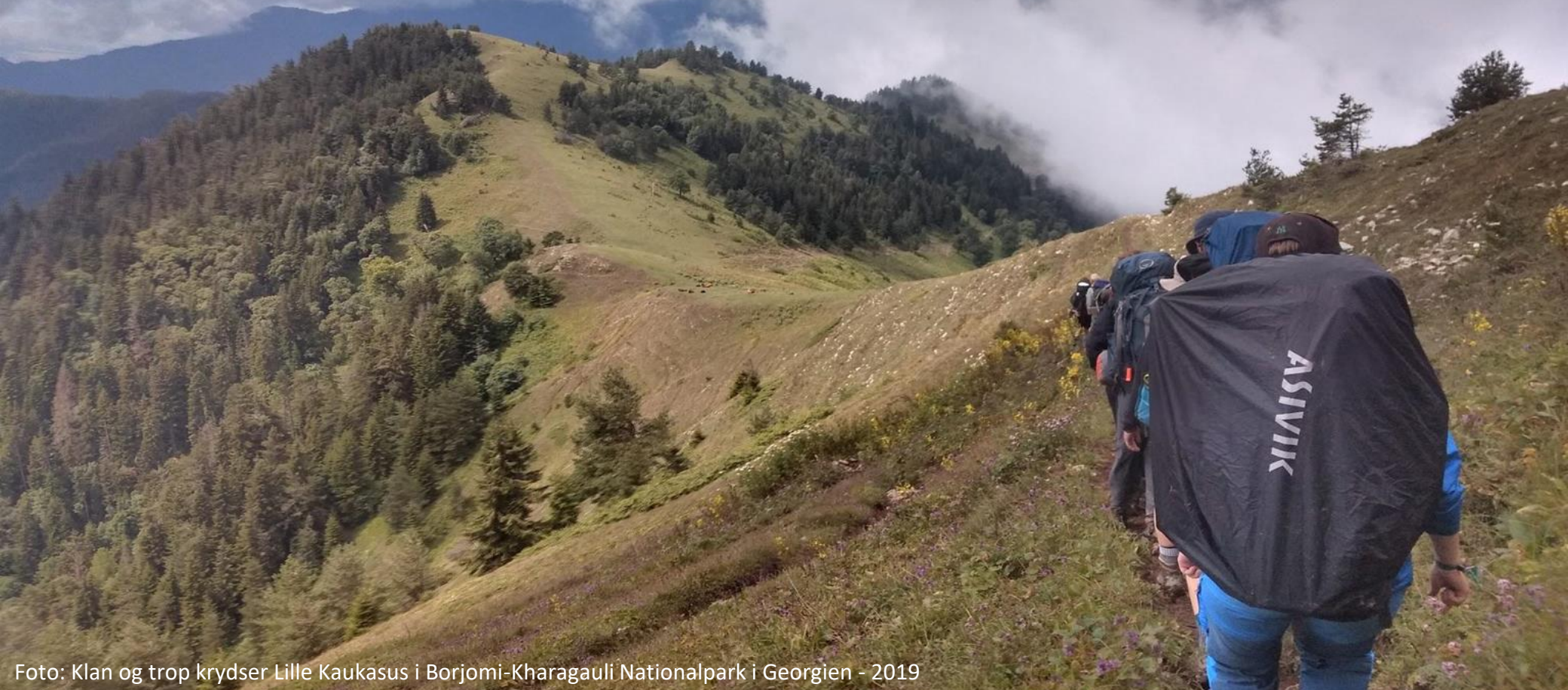
Foto: Klan og trop krydser Lille Kaukasus i Borjomi-Kharagauli Nationalpark i Georgien - 2019