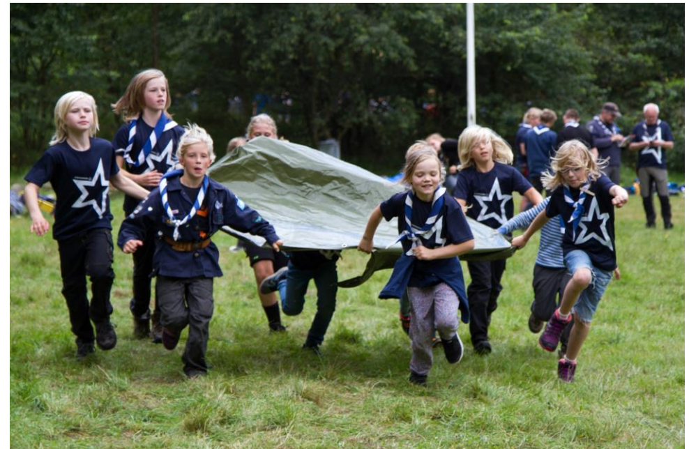
Foto: Junior på samarbejdsøvelse - Hylkedam 2018