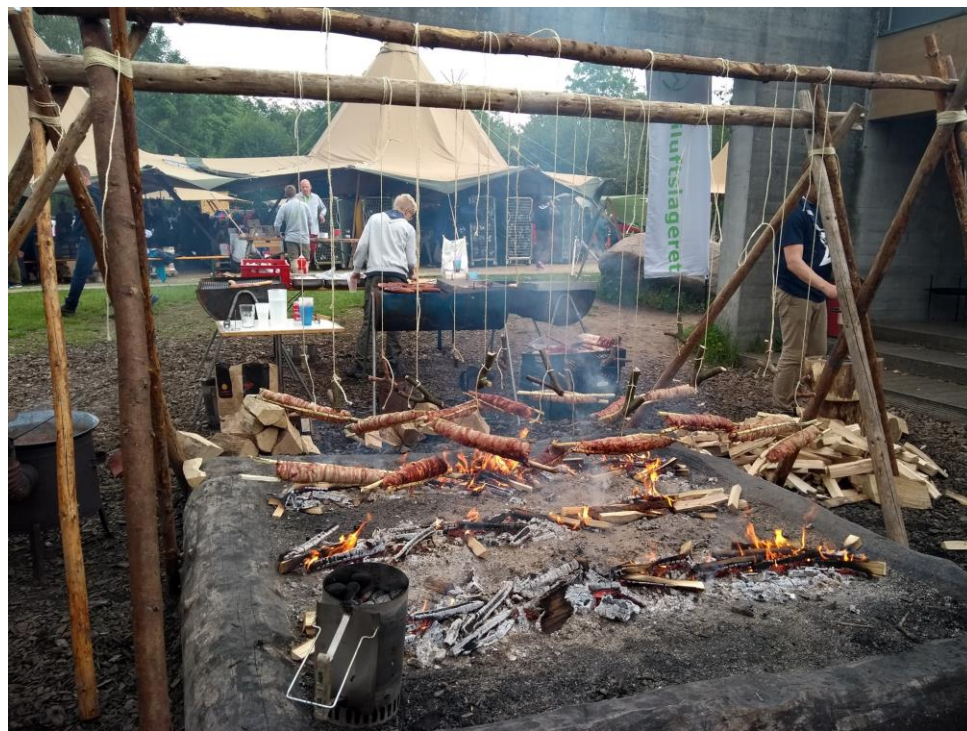
Foto: Stjernespejderne laver mad til Gårdsalg - 2019