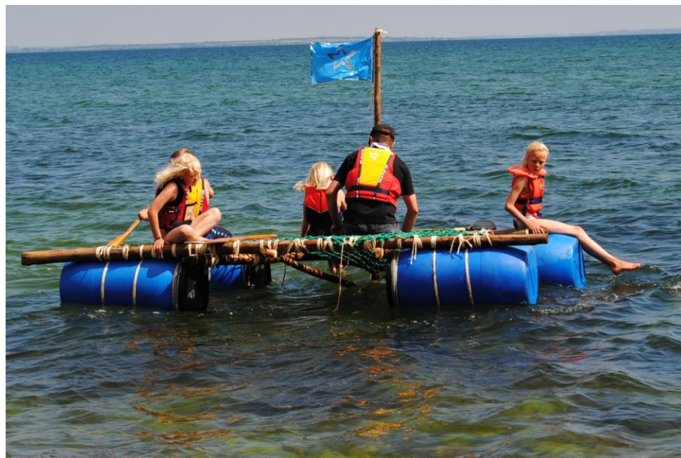
Foto: Mikrospejdere sejler på tømmerflåde ved Thurøbund